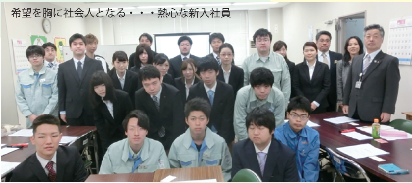
希望を胸に社会人となる・・・熱心な新入社員