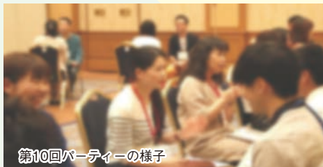
第10回パーティーの様子

当事業は稲敷市と共催しているもので今回が10回目、1対1での自己紹介や食事しながらのフリータイムで会話を楽しんでいただく形式、今回は2組のカップルが誕生、今までに10組のカップルが成婚している人気事業です。