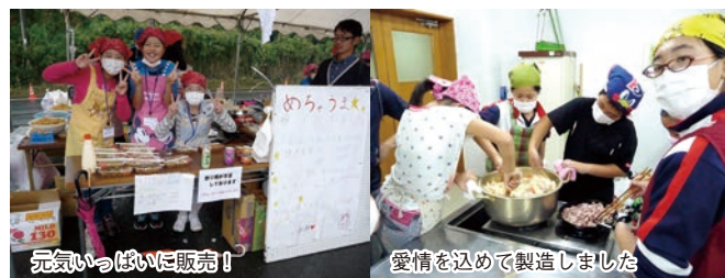
元気いっぱい販売!