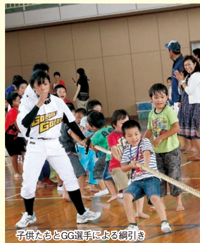
子供たちとGG選手による綱引き