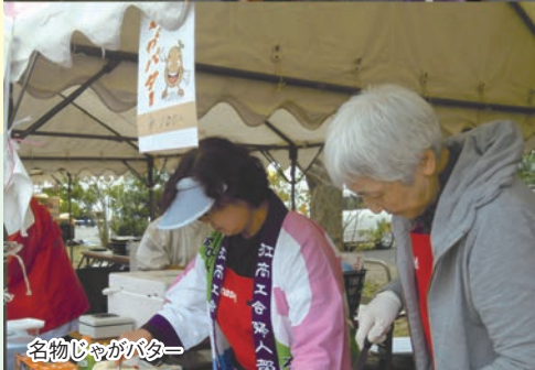
名物じゃがバター