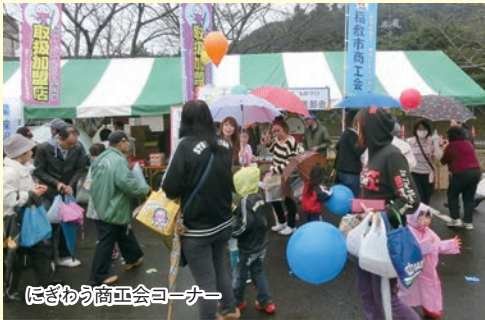
にぎわう商工会コーナー

参加協力いただきました皆様、ありがとうございました。またご来場いただきました市民の皆様には感謝申し上げます。