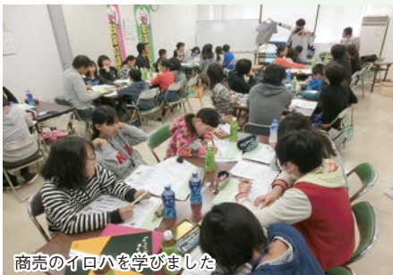
商売のイロハを学びました

「めざせいなしき未来の社長」をスローガンに江戸崎小・沼里小・鳩崎小・新利根小の5・6年生、計36名が参加。約1ヶ月間、商売を一から勉強し事業計画書を作成、青年部から融資された資金で材料を仕入れ「焼きそば」「チュロス」「ストライクアウトゲーム」「カレーライス」「クレール」を販売。いずれも子供達が前夜仕込んだ商品で「めっちゃうま☆焼きそば」や「沼つくすクレープ」など、思いの店名で開店に臨み、開店の9時からお客さんがひっきりなしに訪れ子供たちは大忙し。お昼過ぎには各店売り切れの盛況ぶりでした。