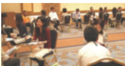
写真は前回の様子