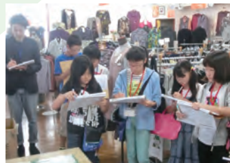
商店街を視察しました!