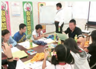
商売について勉強!