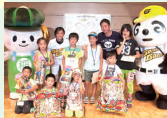
上位入賞おめでとう!