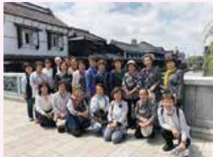
●6月 視察研修会 (とちぎ蔵の街→岩下の新生姜ミュージアム→あしかがフラワーパーク)