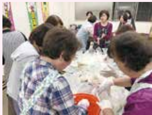
●4月 ゴキブリ団子作り講習会