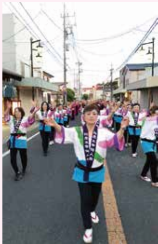
●7月 江戸崎祇園祭り参加