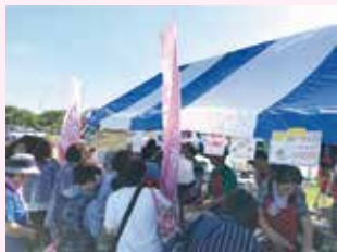
●8月 いなしき夏まつり模擬店出店