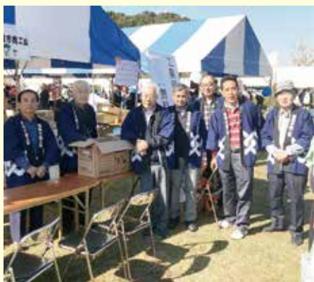
工業部会コーナー

参加協力いただきました皆様、ありがとうございました。またご来場いただきました市民の皆様にご感謝申し上げます。