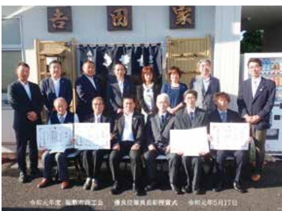
令和元年度 稲敷市商工会 優良従業員表彰式 令和元年5月17日